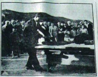
D. Cornelius Zelea Codreanu, lucrând prima căramidă în Tabor...